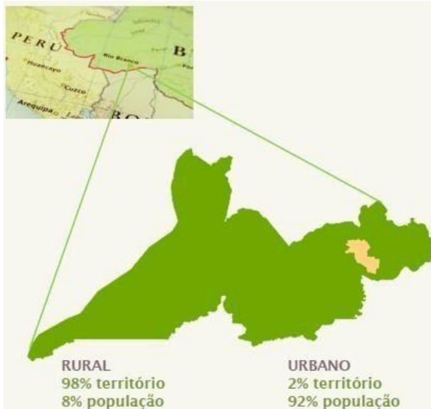
Figura 1 – Dados Gerais do Município