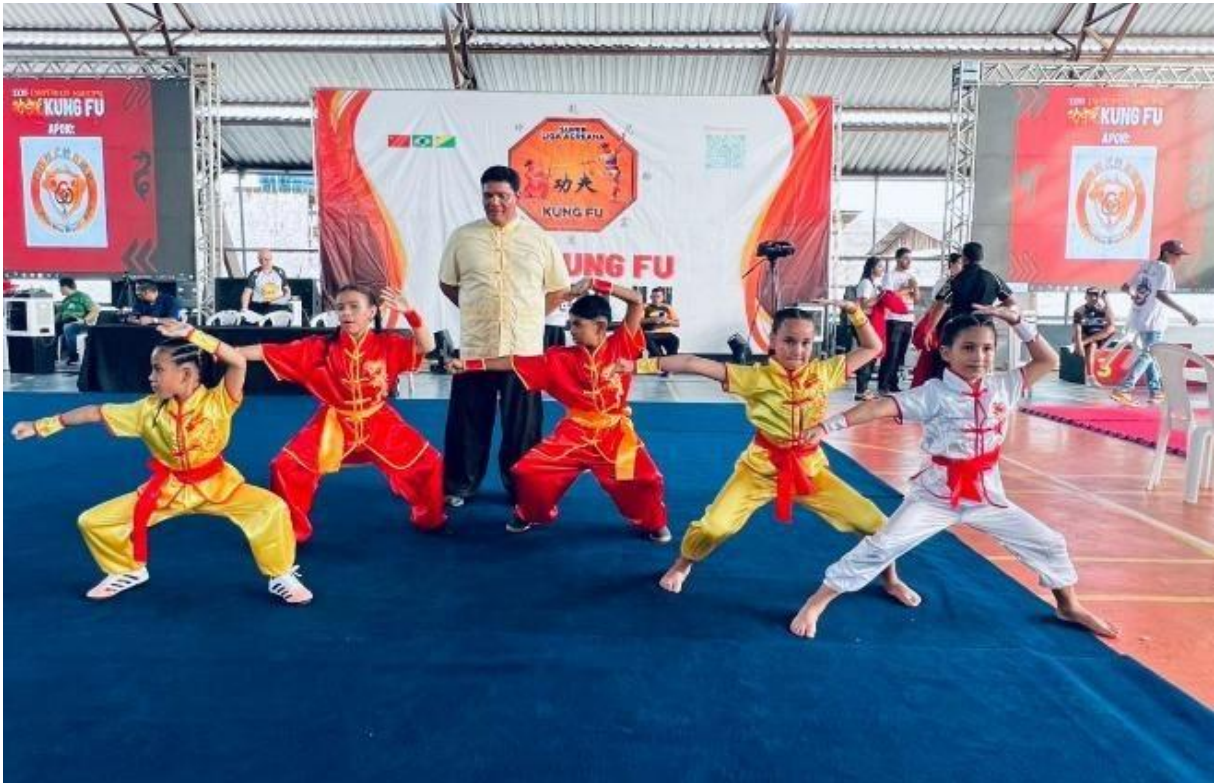
2º Aniversário da Arena Race – 27 e 28 de novembro 2025