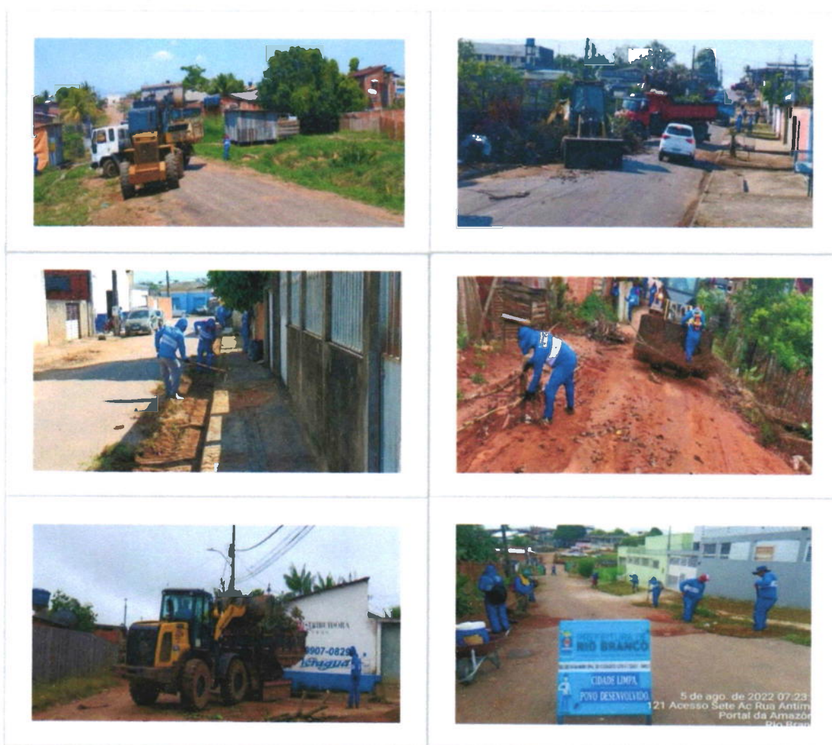
Figura 2 – Mega Mutirões realizados nos bairros