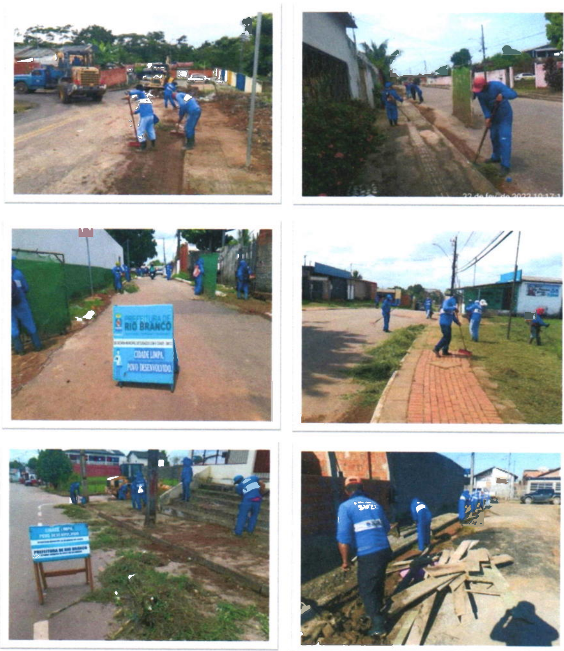
Figura 3 – Limpeza e Conservação dos 231 bairros das 10 regionais