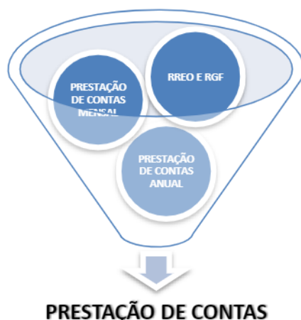
Figura 1 - Ilustração da convergência dos processos de trabalhos em um único

Convergingo esses três processos de trabalhos em um único, o sistema permitirá que, ao longo de sucessivos envios de informações mensais, a prestação de contas anual seja resultado do acúmulo e consolidação destas informações, ou seja, a prestação de contas anual será fracionada em várias partes, e será o resultado da soma destas partes. É importante esclarecer que apesar do escopo das informações serem mensais, e tomando como base o acompanhamento realizado através da apreciação do Relatório Resumido de Execução Orçamentária e o de Gestão Fiscal, o envio destas informações ao Tribunal ocorrerá ao encerramento de cada bimestre.